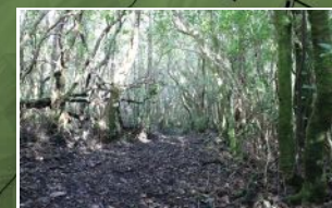
Antigo caminho de carros de bois Old tracks for ox carts