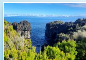
Zona Costeira da Furna Coastal Area of Furna