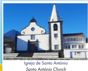
Igreja de Santo António Santo António Church